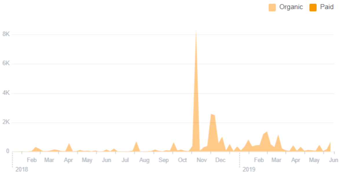
10. ábra: MSJJSZ Facebook oldalának elérési mutatója.